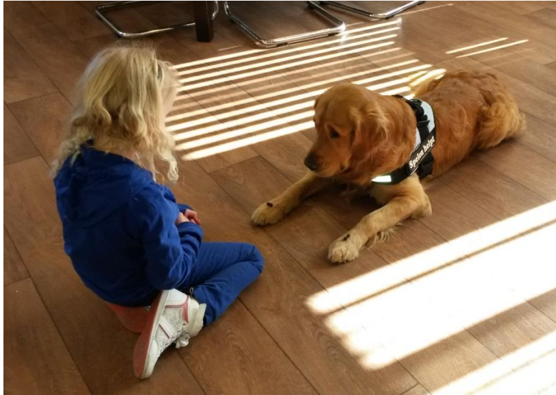
Oefenen van commando 'blijf af'

Naarmate Eefje steeds weerbaarder wordt, moet de moeder van Eefje steeds meer moeite doen om haar mee te krijgen aan het einde van de spelsessie: "Mama, nog één kusje!"